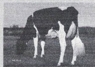
HARCLIFF BLUFF 767